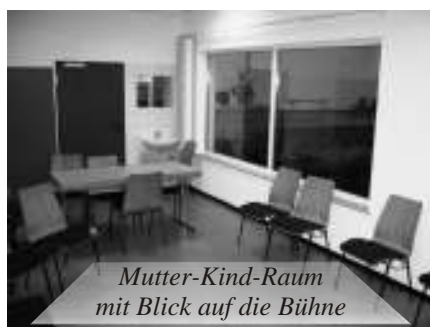
Mutter-Kind-Raum mit Blick auf die Bühne