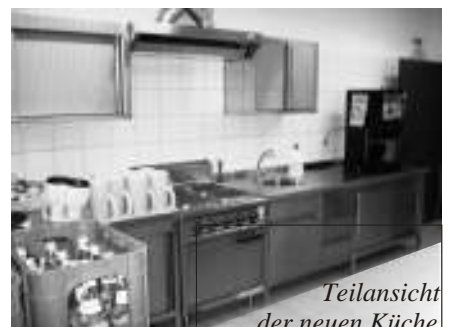
Teilansicht der neuen Küche