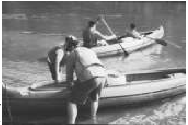
“Vater und Sohn in einem Boot.” Die Fotos entstanden auf dem Vater-Sohn-Wochenende 2000 an der Lahn.

Eine Studie der Universität Oxford (unter 500 Jungen, 13-19 Jahre, 1999) belegt, dass Jungen ihr Selbstvertrauen trainierten, indem sie Zeit mit ihren Vätern verbringen. Über 90% aller Jungen, die sich von ihren Vätern ernst genommen fühlen, zeichneten sich als Optimisten mit einem hohen Maß an Selbstvertrauen aus. Dagegen hatten 72% der Jungen, die wenig Kontakt zu ihrem Vater hatten, ein schlechteres Selbst-